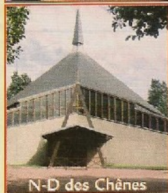
N-D des Chênes