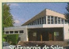
St-François de Sales